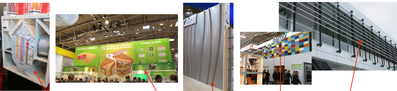
<BAU> 熱交換に潜熱が？ 断熱は静かだが、新参の木質が派手に 外壁もデザイン化 さすがにOSUMO ルーバーがさりげなく…