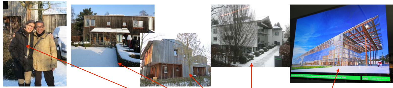
<カッセルエコ団地> 1993年依頼の訪問 ヘッガーさんの自宅と岩村さんの家 ヘッガーさんの事務所 最近はこのエコ建築を設計