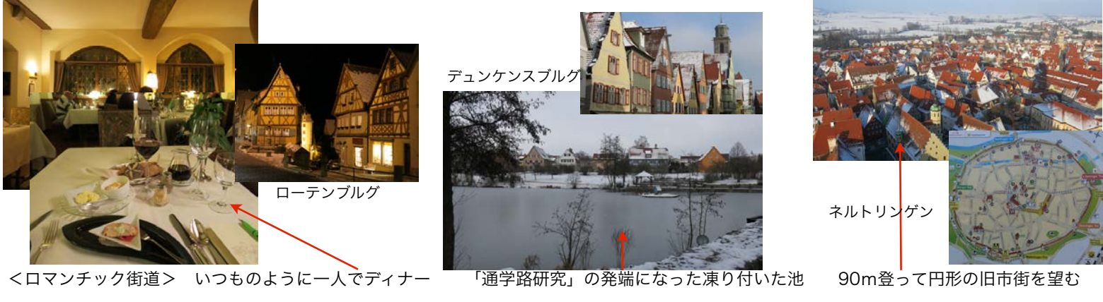
<ロマンチック街道> いつものように一人でディナー 「通学路研究」の発端になった凍り付いた池 90m登って円形の旧市街を望む