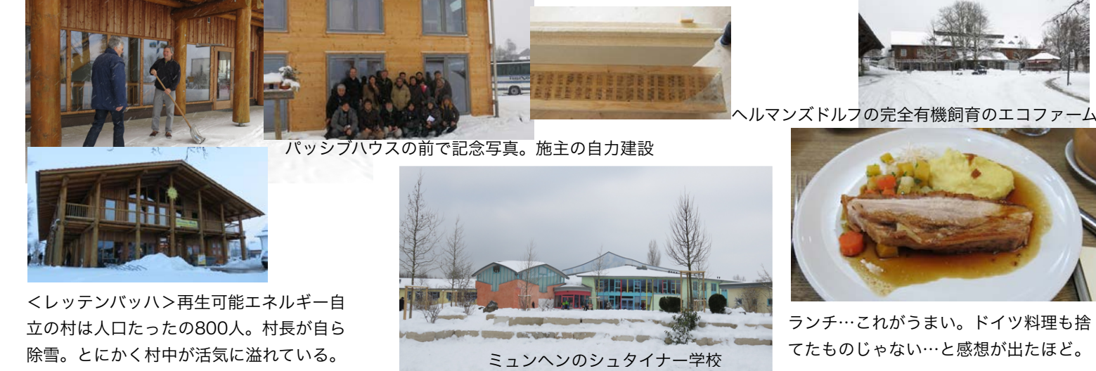
<レッテンバッハ>再生可能エネルギー自立の村は人口たったの800人。村長が自ら除雪。とにかく村中が活気に溢れている。 ヘルマンズドルフの完全有機飼育のエコファーム ムンヘンのシュタイナー学校 ランチ…これがうまい。ドイツ料理も捨てたものじゃない…と感想が出たほど。