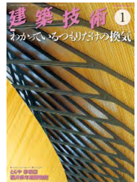
建築技術2019年1月号 特集「わかっているつもりだけの換気」 監修：南雄三、田島昌樹

省エネ、エコが専門だが、業界を知り尽くした目で、業界のお目付的存在。建築技術1月号の特集は南雄三監修で1997年から22本監修している。換気特集は1997年、2003年以後の16年振り。